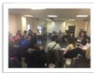
Fotografija participativnog sastanka